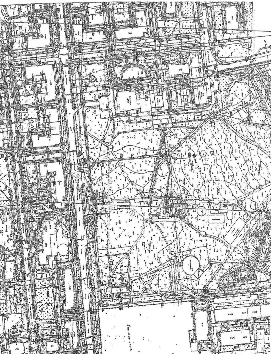
Приложение 3 к постановлению Администрации города от 11.11.2021 №2622-п